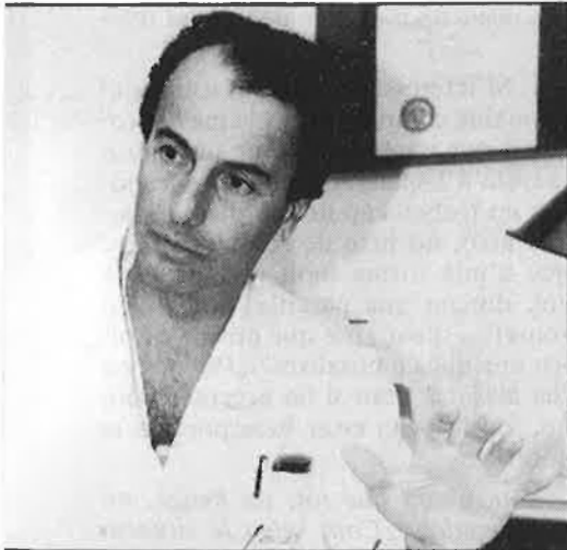
«Val la pena estar incorporat a la política.»

va no té més remei que aguantar; si no, un vol ser propietari de les seves decisions mèdiques. En principi, és molt interessant que la relació metge-pacient sigui lliure pels dos costats. Aquest és un argument que esgrimeix la dreia clàssica reaccionària, per carregar-se tot un seguit d'activitats que són realment progressistes dintre la medicina. Però jo no ho dic en aquest sentit, ho dic en el sentit que és