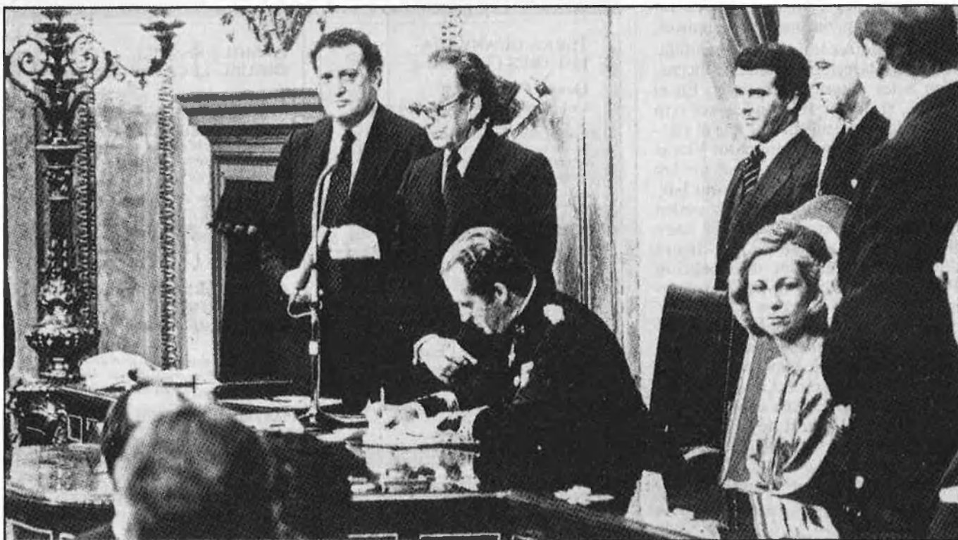
LA SAGA DELS BORBONS