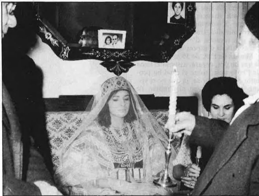
Rites hebreus a València.

Curiosa és també l'actitud dels dirigents de l'Estat espanyol, que no han portat a terme el lligam diplomàtic amb Israel fins al moment en què no hi ha hagut més remei. Comenta aquesta peculiaritat el professor Joan B. Culla, de la Universitat Autònoma de Barcelona: «L'Estat espanyol s'havia obstinat, de forma irracional jo diria, a no reconèixer l'estat d'Israel.