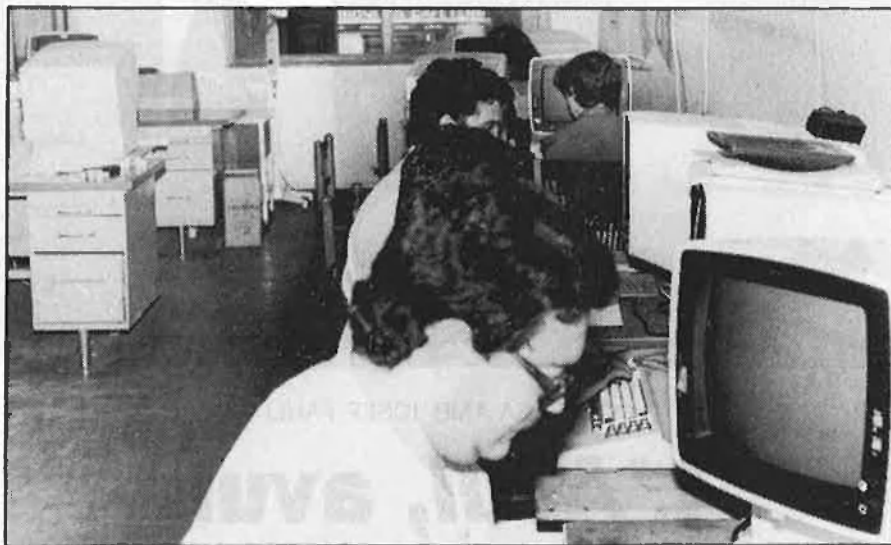
Dalt, la reconversió tecnològica demana un canvi de mentalitat. Baix, hi ha una estreta relació entre règim de llibertat i premsa pluralista.

Convé observar que una bona part d'aquests diaris són anteriors a la mort de Franco. Però ja una notable proporció són posteriors al franquisme o s'han remodelat substancialment (els de l'antiga cadena del Movimiento, privatitzats fa pocs anys). En aquest sentit, hi ha un fet especial que sobresurt sobre el conjunt: l'aparició del diari madrileny «El País» i la seva efectiva expansió fins a cobrir de manera sistemàtica tota la península. Es tracta d'un fenomen nou a Espanya i especialment a Catalunya, ja que el diari hi inicià una edició pròpia que ven ara uns 64.000 exem-