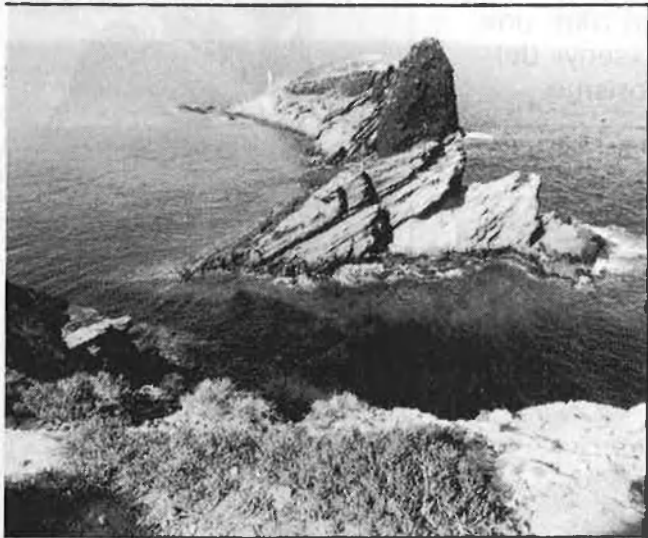
Els Columbrets, finalment protegits.

dels Columbrets com a Parc Nacional Marítime-terrestre és una bona notícia, llargament esperada pels qui ens preocupem pel deteriorament ecològic i la destrucció de paratges naturals que han afectat en les últimes dècades el País Valencià amb especial fúria.