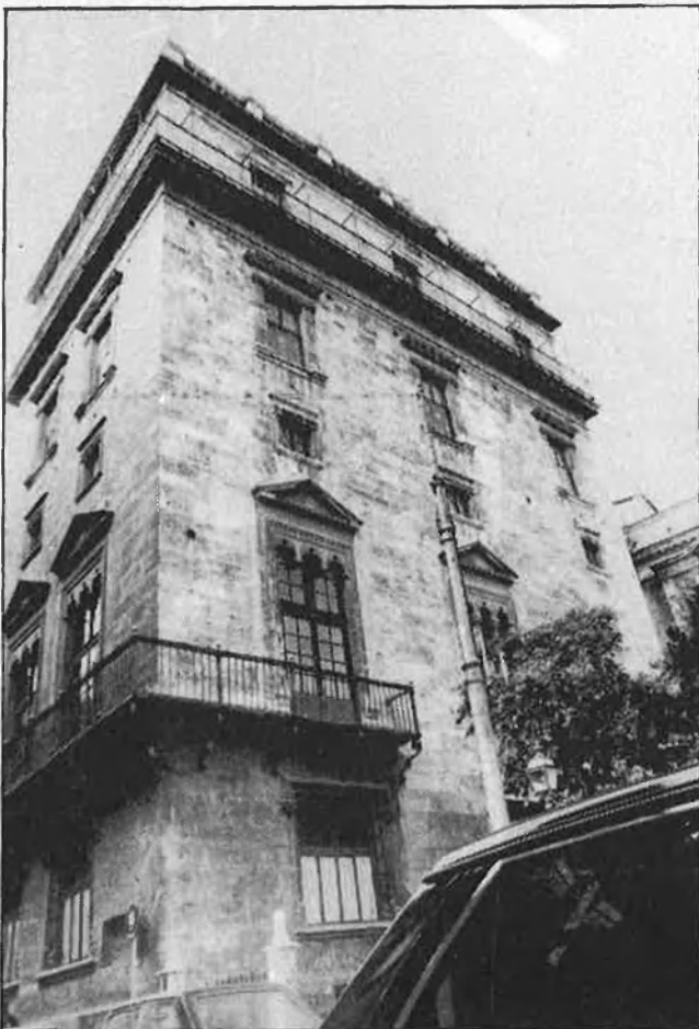
Massa triunfalisme en la Generalitat.

«L'autonomia valenciana —assegura l'informe— comença a marcar el seu perfil, en el conjunt de l'Estat de les autonomies, com a políticament estable, socialment plural, culturalment brillant i inserida de ple en un procés accelerat de modernització econòmica impulsada, en bona mesura, per les exigències de la seua adaptació a l'Europa Comunitària».