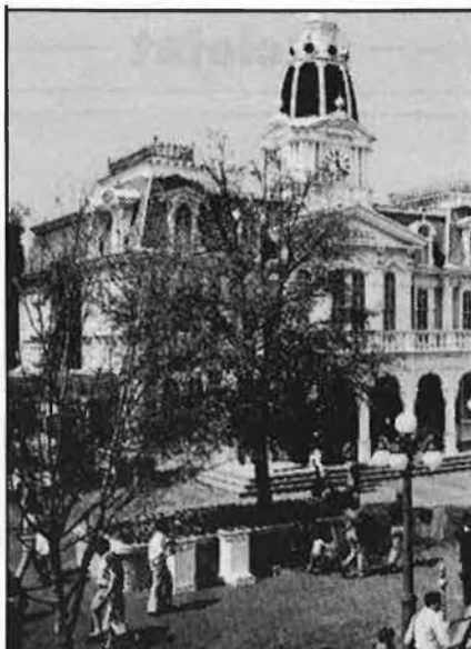
Serà París on definitivament s'instal·larà Disneyland.

Pel que fa a les localitats que haurien estat afectades per la instal·lació del parc d'atraccions, no hi ha hagut en cap moment un especial entusiasme entre la població. L'actitud, entre recelosa i expectant, s'ha caracteritzat per una evident perplexitat. D'aquí que l'anunci que Disneyland es construiria a París haja suscitat, fins i tot, una sensació d'alleujament.