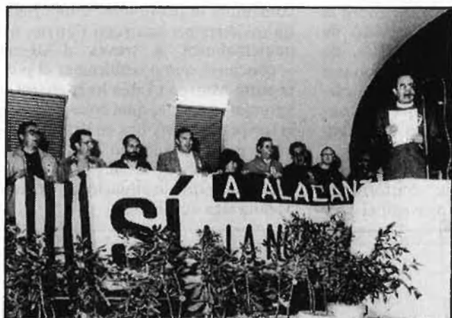
Discurs de l'ex-conseller Barceló a Alacant.

Admetre que el moviment nacionalista està madurant, creixent i consolidant-se a totes hores, era massa fort per a un partit que havia volgut decretar-ne la defunció fa ja