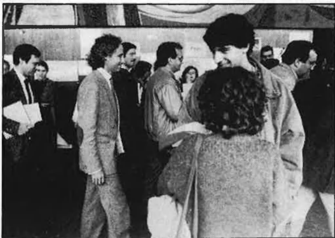
Incidents a la Facultat de Filologia.

Sobre el dinar amb Lerma planà l'ombra de Disneyland volant cap a París definitivament com també l'assignatura pendent de la Televisió Valenciana i les repercus-