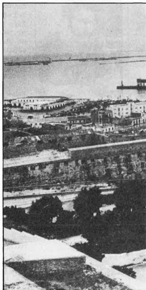
Melilla és considerada en els documents com una plaça d'una importància inferior a Ceuta.

Les trenta pàgines d'aquest Informe sobre Ceuta i Melilla són en realitat el guió d'una conferència impartida