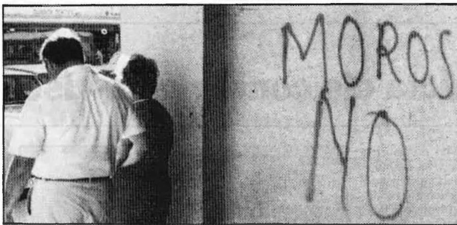
Les reivindicacions musulmanes han provocat tensions durant els darrers mesos a les dues ciutats.

permanent és de 7 a 11.000 persones, el 23 per cent»), que provoca una «pressió immigratòria molt major».