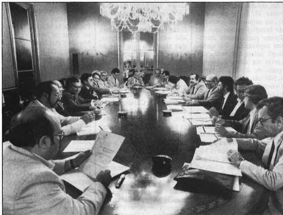
Una sessió del Consell assessor de Cultura

No es tracta tan sols d'un problema polític. Totes les forces implicades coincideixen a qualificar l'acord subscrit el passat dia 12 de juliol com a històric, ja que, des de 1981, els ajuntaments i l'esquerra política del país reclamaven la necessitat d'arribar a una «entesa cultural». «Després de quaranta anys sense cap mena de planificació ni possibilitat d'actuació —com diu Jau-