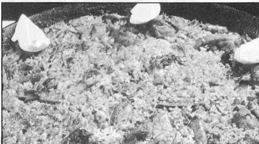
De dalt a baix, paella de la Dàrsena; filets de molls, d'El Dorado Petit, i costelles de be a les fines herbes, del Reno.

Camí de València, a Cullera, trobem Les Mouettes, destacable, a banda el menjar, per la panoràmica, i, curiosament amagat darrere un bar de carretera, la Casa Galbis, de l'Alcúdia. A la ciutat de València, discutit i polèmic, Ma Cuina és de visita obligada, amb l'etern Casa Eladio, un clàssic on un bon plat de peix i les múltiples variants de la torrada suïssa es fan de bon menjar.