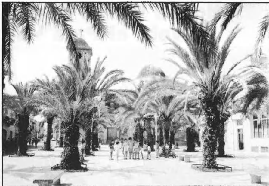
Dalt, parc d'Oriola. Baix, l'Albufera, a València.

Tot eren també descobriments per al rei Jaume, que, en 1240, possessionat de Cullera, aconseguí la rendició dels castells de Bairén (Gandia) i Alfandec de Marinyén (la Valldigna). Dos anys després, obtindria Alzira i, més tard, Xàtiva. En 1245, Biar (on, pel tractat d'Almizra, s'havia fixat els límits de la conquesta catalanoaragonesa). Era la línia Biar-Bussot.