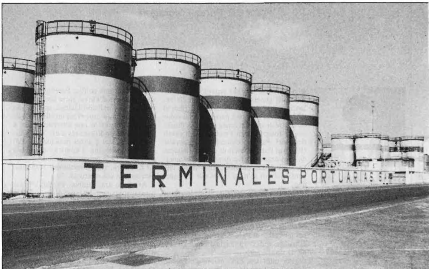
UBICADA AL PORT DE VALÈNCIA