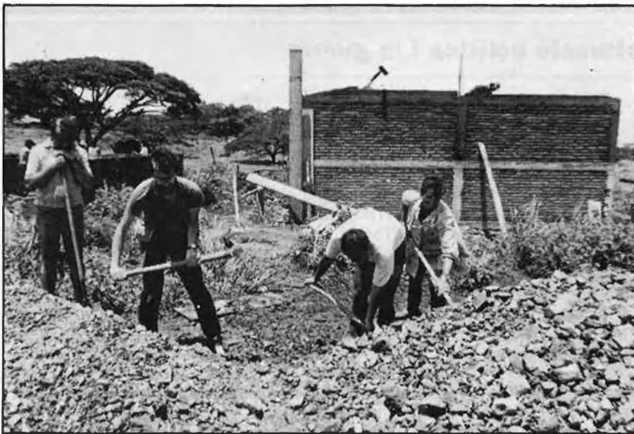
Dalt, brigadistes catalans treballant en una granja a Matiguás. Baix, la constitució a Barcelona de l'Associació Catalana de brigadistes.

CONSTITUÏDA UNA ASSOCIACIÓ DE BRIGADISTES