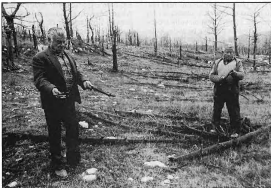
A l'esquerra, la Tèrmica de Cercs. A la dreta, dalt, els germans Perearnau. Com si hagués passat el foc. Baix, el fum, pujant al Portet, a Vallcebre.