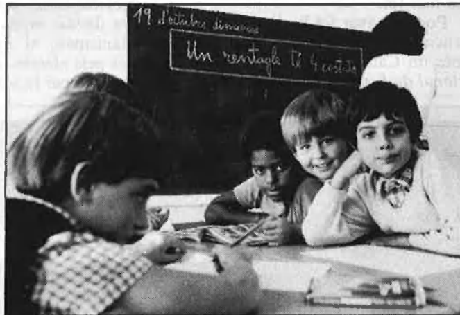
La política cultural del PSOE, un projecte d'assimilació.

guerra, l'assimilació/neutralització, que tant d'èxit va tenir, amb l'absorció del PSPV, en el camp directament polític. El primer sistema és clar, brutal, vell i conegut, el de sempre: un intent incessant de liquidació, moral, i si pogués ser física. El segon sistema és més subtil.