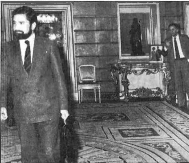
González no entén Lerma.

La frase té un aire provocatiu digne del vice-president Alfonso Guerra i il·lustra, d'una banda, el grau d'irritació que el tema ha produït en La Moncloa, des d'on es personalitza en el president Joan Lerma la demanda d'una televisió autonòmica i, de l'altra banda, exemplifica la decebedora imatge que, dels problemes del País Valencià, en té el màxim governant de l'estat. González ignora els arguments de viabilitat i les motivacions favorables a la normalització lingüística, a l'accés de la llengua pròpia dels valencians als mitjans de comunicació de masses, que han fonamentat l'exigència oficial de TVV.