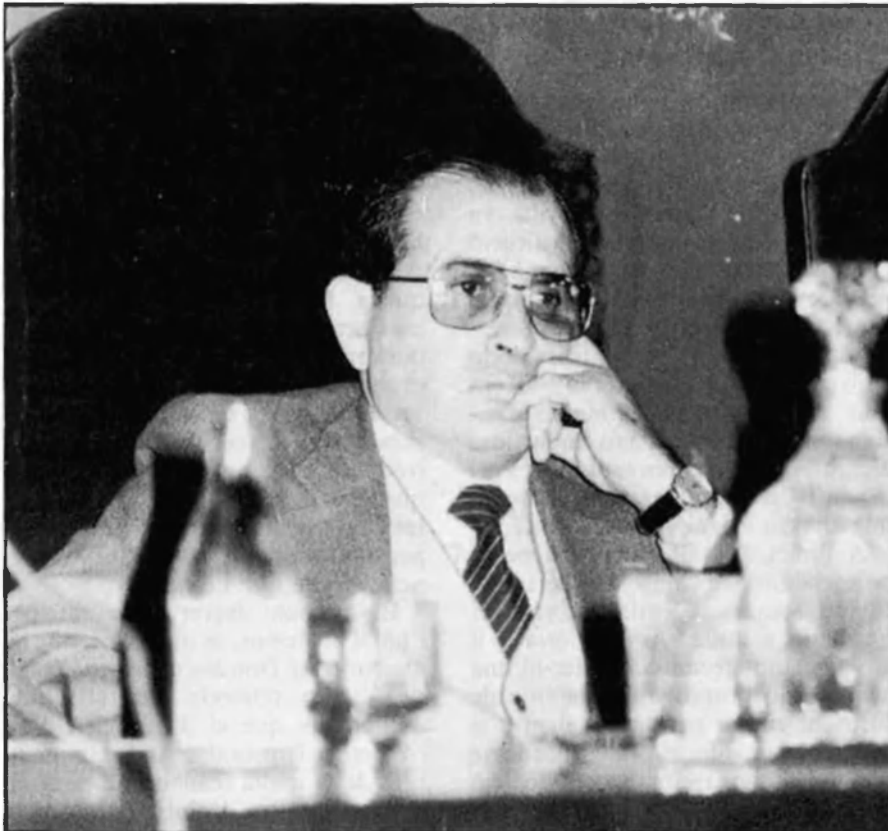
Opositor copió de variable fortuna.

El to de pinxo tavernari que gasta no ens pot fer oblidar que ho ha pensat, i ho ha fet. Durant cinc anys, la figura, petitona però lletja, del candidat al Consell proposat per la Coalició Popular, i acceptat, segons sem-