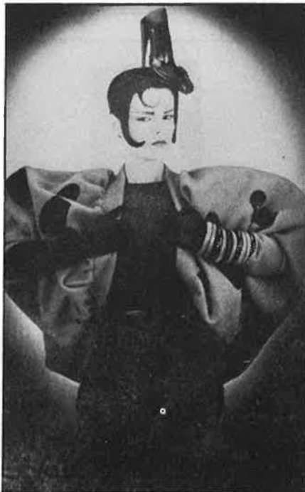
Una tendència geomètrica.

L'obra d'aquest artista català supera el personatge. Potser per aques-