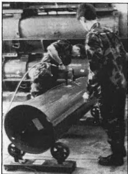
Experts de l'OTAN amb un míssil «Titan».

la presidència. Després de quatre anys en què va exercir una política ultranacionalista («Torna Amèrica!» és el seu lema favorit) i una criticada política econòmica que, de moment, ha donat resultats, però que a la llarga pot ser tremendament perjudicial, Reagan tornà a ser escollit, enmig d'una de les campanyes electorals més triomfants que es recorden, i a pesar de la seua avançada edat —és el més vell dels presidents americans— i