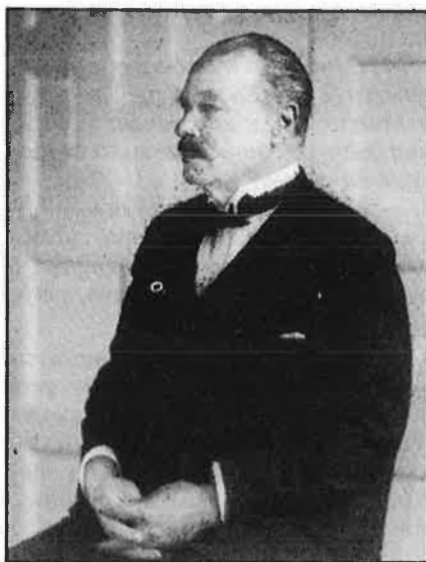
August Sander: «Els boxadors». (1928). El gran duc d'Hessen Nassan (1928). Home de negocis jueu (1936).