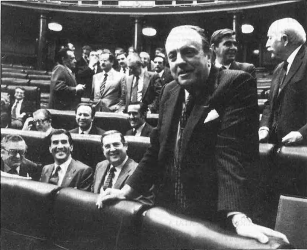
A l'esquerra, Oscar Alzaga i Miguel Herrero de Minón. A la dreta, Manuel Fraga, al Congrés.

A partir del catastrofista discurs de Manuel Fraga, arran del debat sobre política general a final de 1983, el govern s'adonà que els únics poders reals amb representació de les Corts Generals eren a Victòria i a Barcelona. I durant quasi dos anys les úniques negociacions serioses que s'han entaulat des de La Moncloa han estat amb la Minoria Catalana i el PNB. Això no vol dir que no hi hagi hagut escandaloses coincidències amb la CP (la Llei Electoral o la Llei de Policia), o que no hi hagi hagut grans discre-