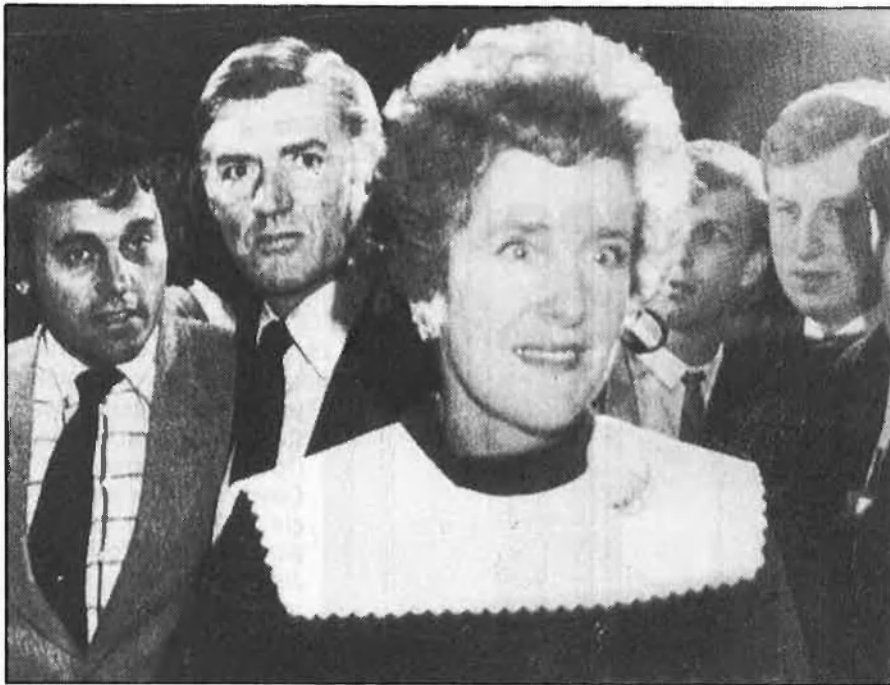
UNA SECRETÀRIA AL CONGRÉS