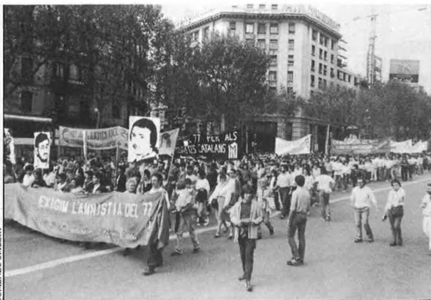
Manifestació pro-amnistia, el vint d'octubre, a Barcelona.