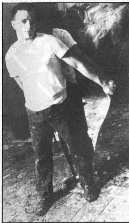
Morea i Baldeon, dos representants de l'avantguarda pictòrica valenciana, estan presents a Interarte.

els professionals de la nostra cultura, dels sectors més dinàmics de la societat valenciana; la presència de les tendències més renovadores de l'art actual, a través de les galeries més significatives. I també més horitzó de propostes estètiques, malgrat l'eclecticisme implícit que comporta una denominació tant extensa com «Fira de l'art». És l'hora de potenciar les nostres inversions artístiques i els seus representants, els artistes. El repte ha estat llançat de cara al futur. De tots dependrà, un poc, la realització d'una fira competitiva, arrelada en la nostra societat i amb projecció decididament europea. Ara disposem-nos a contemplar l'obra d'un Miró, d'un Tàpies, d'un Rafols Casamada, Gordillo, Eduardo Arroyo, l'equip Crònica, etc, que ocasions com aquestes tampoc no es presenten cada dia. □