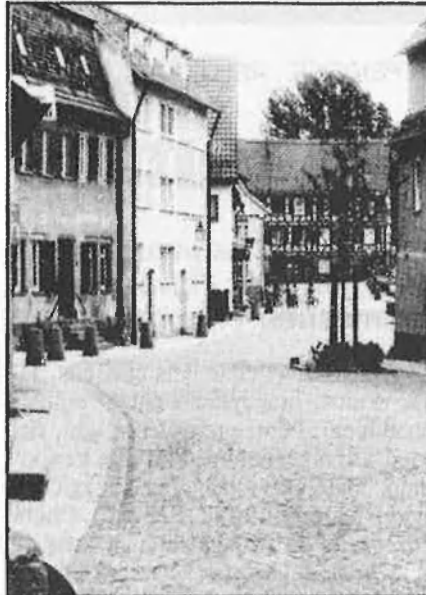
A l'esquerra un exemple de desaparició de la vorera; a la dreta l'aigua recupera la seua importància a través de fonts i canalitzacions.

Una parada d'autobús pensada per a esperar còmodament.