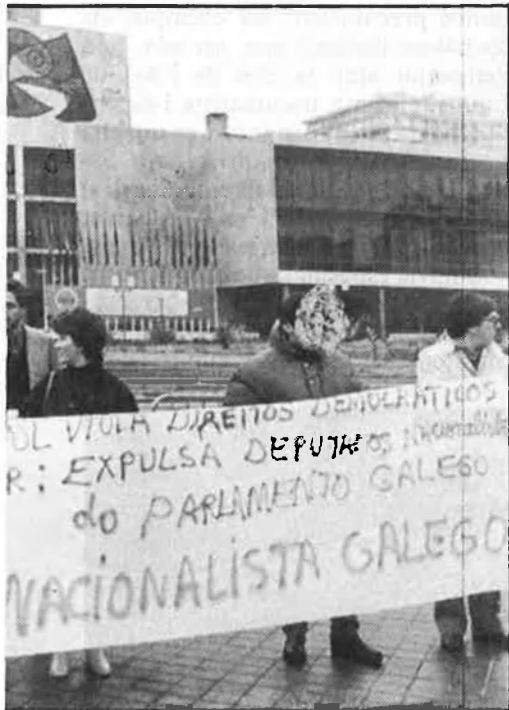
Aquesta vegada, els diputats del Bloque ocuparan els escons; a la dreta, Fraga, que sempre espera molt de les eleccions gallegues.