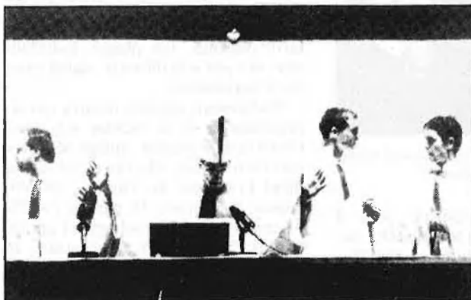
Tres escenes del muntatge « Teledium », «blasfem» i «sacríleg».

els aspectes i les creences més rellevants i transcendents dels qui professen la religió catòlica».