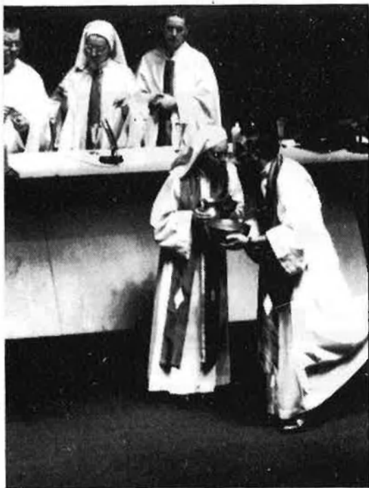
Segons la denúncia, l'obra conté «clara intenció de profanar rites».

processos. Un article publicat a Cartelera Turia , titulat «Teledium, el juez y los ultraderechistas», ha estat considerat pel fiscal com sospitós de contenir expressions poc respectuoses envers el poder judicial, personificat en el jutge Forteza, que no sembla gaudir d'un excessiu sentit de l'humor.