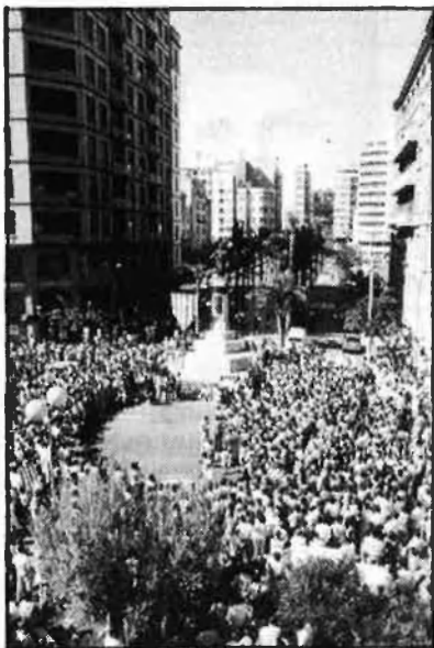
V. Partal i A. B.

Tant l'acte d'homenatge a la senyera, al matí, com la manifestació convocada a la vesprada, per UPV, a Castelló tingueren un caràcter reivindicatiu, que els actes institucionals s'entestaren a esborrar de la celebració del 9 d'Octubre.