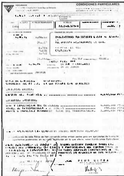
Assegurança del restaurant Arrantzale.

Les incògnites són enormes. El «cas Arrantzale» encara és un jeroglífic molt complicat la solució final del qual potser no sabrem mai. Perquè, «tot és molt fosc» per a Joa-