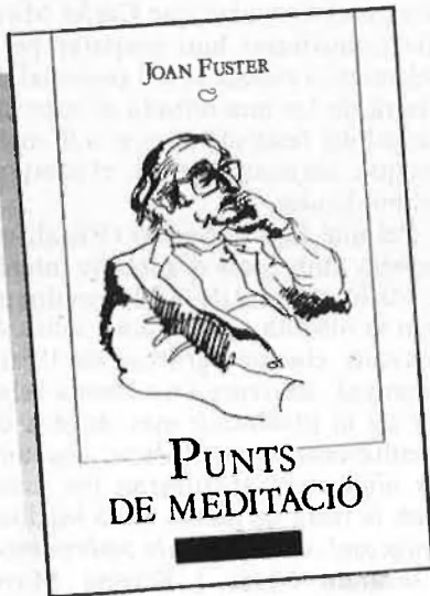
«Punts de meditació», el darrer llibre de Fuster.

Ja fa anys que Baltasar Porcel —llavors infant terrible— va escriure que el millor negoci que podria fer un editor de diaris seria contractar Fuster com a editorialista permanent. Els embolics judicials (encara hi havia la