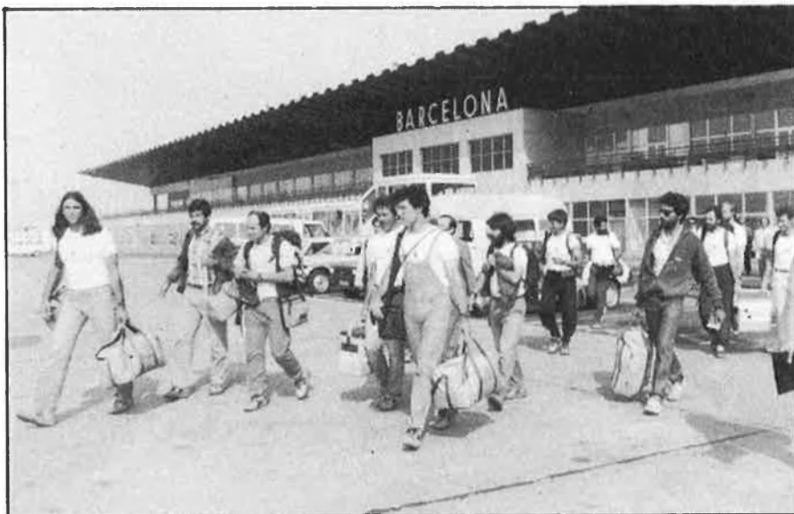
Abans i després. Els expedicionaris partint de l'aeroport del Prat i una imatge de la recepció triomfal, a la plaça de Sant Jaume de Barcelona.

vència al llarg dels tres mesos. Ara, els expedicionaris catalans estan organitzant el viatge perquè aquests xerpes que els van acompanyar en el seu país, el Nepal, vinguin i coneguin Catalunya. Tres d'aquests xerpes també van arribar al cim de l'Everest.