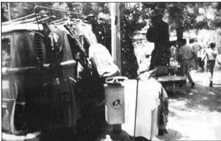
Tropes nasseristes a El Xuf. Soldats a Sabra. A la pàg. 21, supervivència i destrossa a les ciutats.