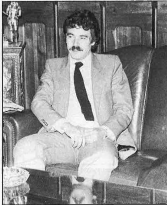
Maragall, alcalde de Barcelona (PSC-PSOE), recorre contra lleis catalanes.

Els qui més són acusats de crispadors i victimistes són els de Convergència i Unió. CiU sempre ha rebutjat aquesta acusació. En tot cas, en alguns medis polítics i periodístics comença a quallar la idea que recórrer contra lleis estatals per defensar l'autonomia no és victimisme. I al