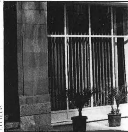
F. C. TIL·LAS

«Arrancàrem, i pareixia que rodàvem cap a Elx. Més avant, se n'eixiren de la carretera i marxàvem a tota pastilla per un camí de terra ple de clots. Allà dins, saltàvem, saltàvem i ens esclafàvem uns a altres. De colp i volta, la ranxera va parar. Vinga, baixa em va fer el més jovenet, el que més venia per mi. Érem enmig d'un