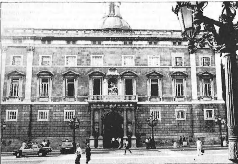
En la pàg. 6, obres de la Generalitat. Qui les pagarà? En la 7, d'esquerra a dreta i de dalt a baix, seu del govern de les Illes, Generalitat valenciana i Palau de la Generalitat de Catalunya.

Caldrà aclarir més això. Quan l'estat era no-autonòmic, centralitzava a la capital tota la despesa i una àmplia capa de funcionariat: a l'hora de transferir serveis i competències no han transferit la despesa —la finançació dels serveis transferits—, sinó que han forçat a crear una duplictat de serveis de funcionariat o, fins i tot, un triple nivell. Com més transferències rep una comunitat autònoma, més creix la seva despesa: hi ha serveis que compten amb l'alt funcionariat a Madrid, els delegats de Madrid a les autonomies, el nivell autonòmic i el creixent funcionariat recentment aparegut a nivell municipal