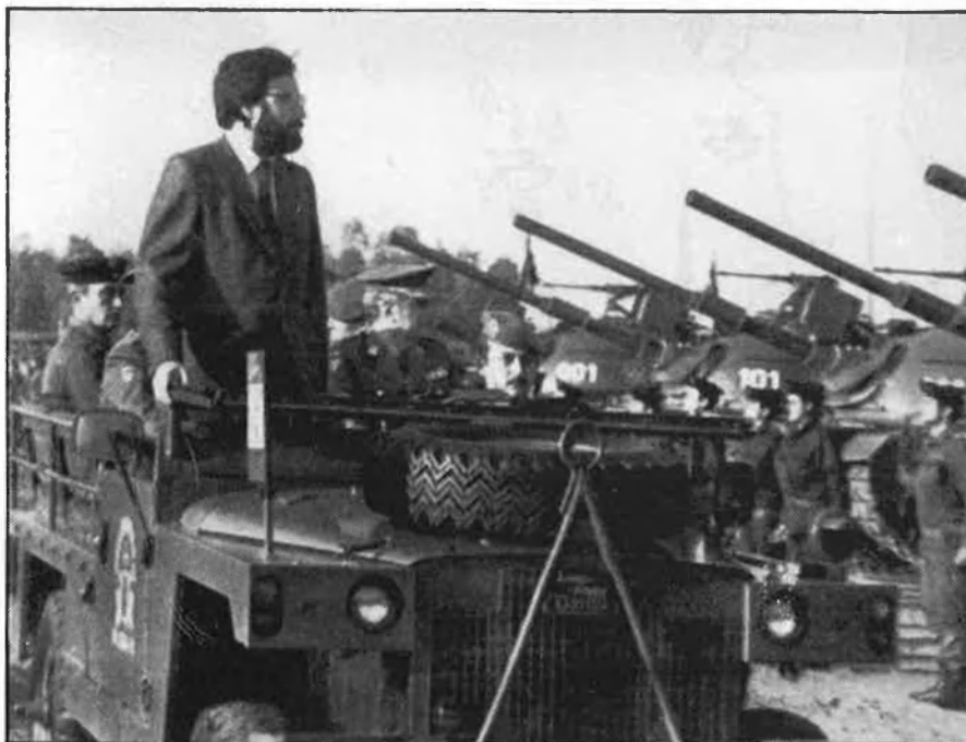
El reforçament de l'exèrcit de terra, un objectiu

El Partit Socialista Obrer Espanyol havia anunciat, durant la darrera campanya electoral, la decisió de paralitzar el «mapa nuclear-militar» i d'«estudiar favorablement» l'oportunitat de ratificar el Tractat de No-Proliferació d'Armament Nuclear.