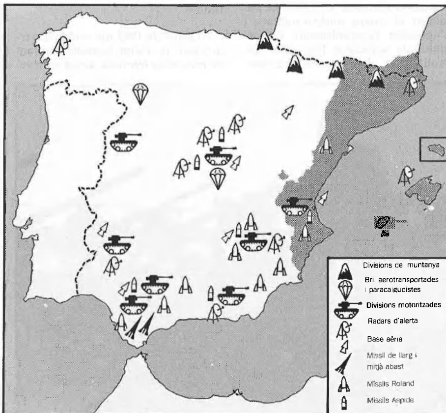
Enclaus armamentístics a l'Estat espanyol.

Segurament —o d'una manera molt principal— només un bastió polític. Avui, amb les noves tecnologies, les dues ciutats ja no són im-