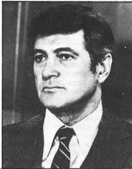
A l'esquerra, Rock Hudson, el detonant social de la malaltia. A la dreta, Robert Gallo i Jean Luc Montagnier; tots dos pretenen ser els primers a haver aïllat el virus.

Els Estats Units d'Amèrica són, ara com ara, el centre d'acció de la mortal SIDA, amb més d'onze mil malalts i un milió de persones que te-