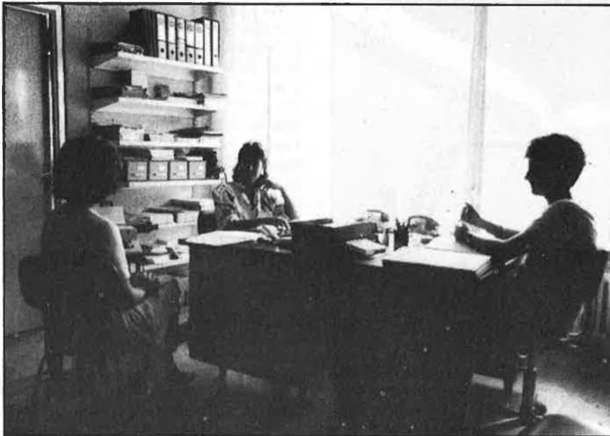
Cada usuària compta amb una detallada història clínica.

La nova proposta també es planteja el problema de la descoordinació en l'activitat dels centres dels ajuntaments catalans. Així, ens trobem amb casos com el de Santa Perpètua de la Moguda, població de set mil habitants, que compta amb un centre que funciona trenta hores setmanals, quan la mitjana de tots els centres de Catalunya és de divuit hores, i que podria acollir persones dels municipis veïns. Aleshores, cal pensar que a l'hora de lliurar aquesta proposta a la Generalitat s'haurà de normalitzar,