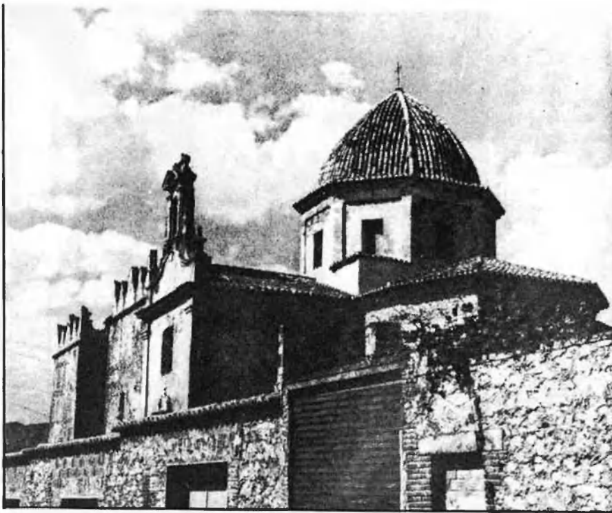
L'església, l'únic edifici «reconvertible» del conjunt.