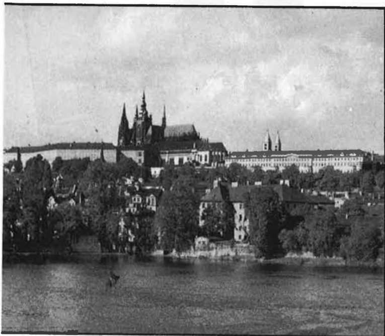
Castell de Hradcany.

Et pot passar una cosa com aquesta, si el primer dia deixes el cotxe aparcad, de por de perdre't pels carrerons, i agafes un autobús d'aquells de visites a la ciutat per fer-te'n una primera idea: et pot passar que la senyoreta guia, expeditiva, et porta a tu i als russos a dalt del castell de Hradcany, et parla dels reis de Bohèmia (per a la senyore-