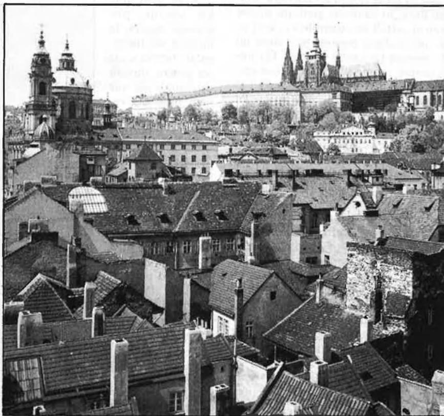
Vista parcial de la ciutat.

Després, aquest Carles va ser Carles VI, emperador d'Àustria i rei de Bohèmia durant trenta anys, durant els quals l'arquitecte Diezenhofer i alguns ajudants italians es van dedicar a convertir la capital en un aparador de la més densa i concentrada arquitectura barroca de l'univers. Sense el Barroc, Praga seria un dels conjunts arquitectònics més impressionants d'Europa. Amb el Barroc, Praga és la