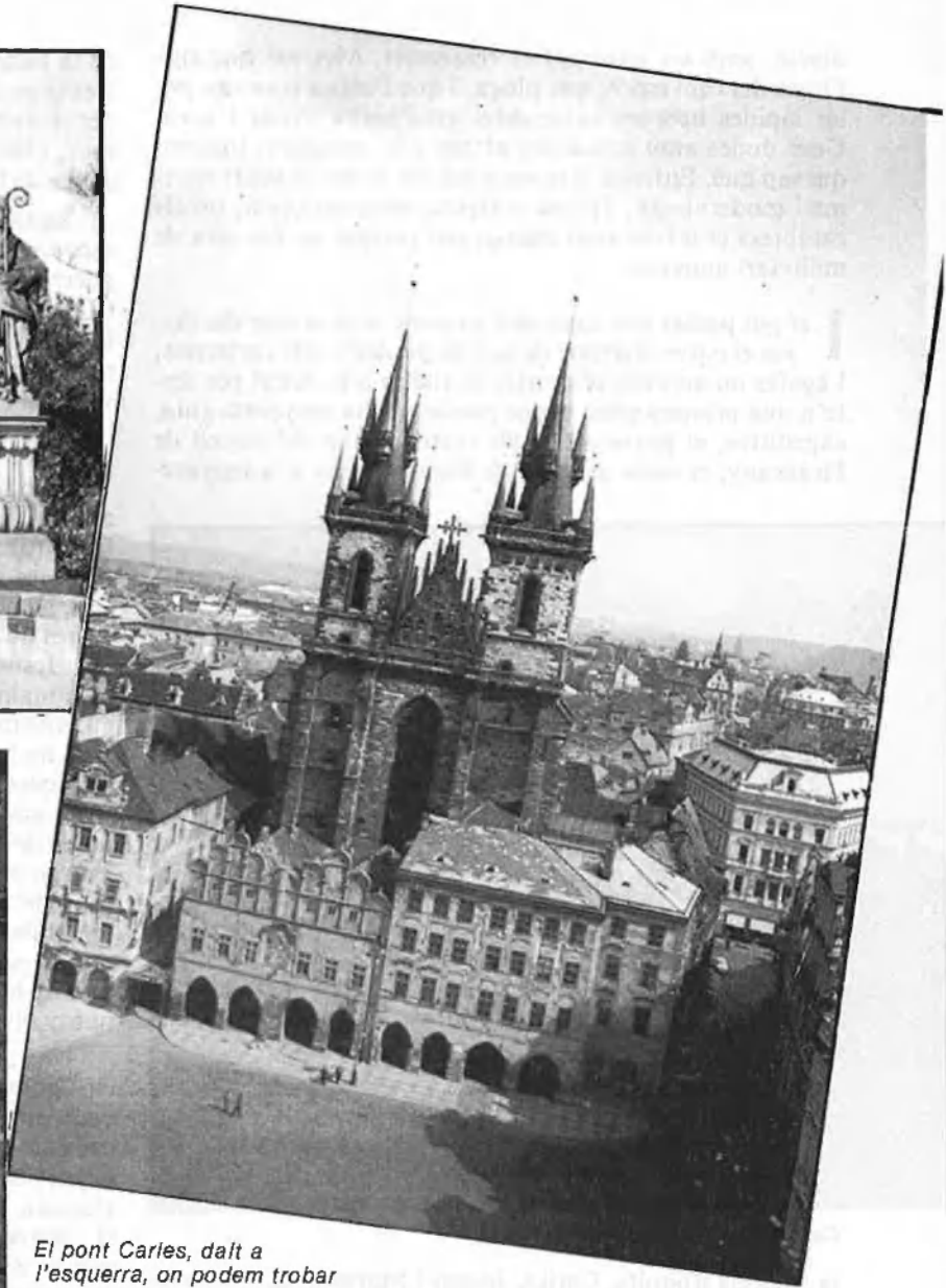
El pont Carles, dalt a l'esquerra, on podem trobar un sant de casa. A la dreta, la plaça de la Ciutat Vella. I, baix, l'Ajuntament i el rellotge.