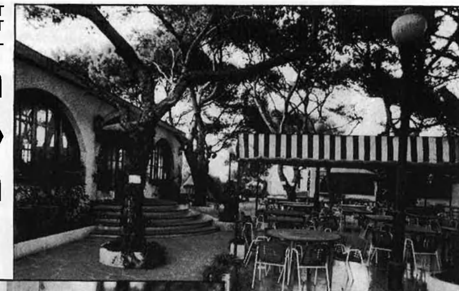
Aspecte interior del restaurant i impacte de bala.