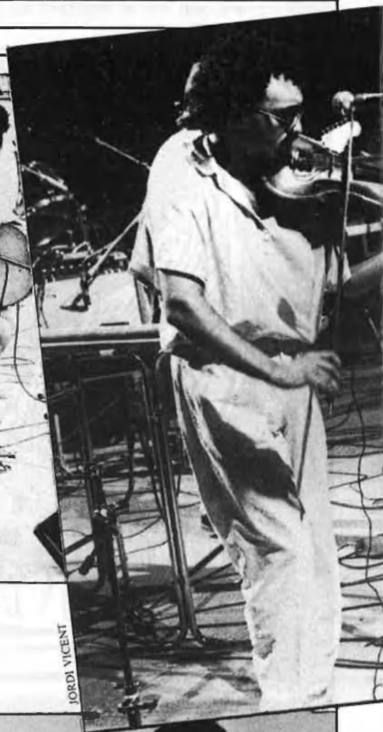
OSKORRI / MILLADOIRO / AL TALL