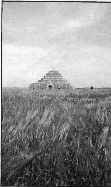
Ciutadella, la vella capital de l'illa. La indústria del calçat, un dels principals suports de l'economia menorquina, avui en crisi. Una barraca per al bestiar: vestigi de l'antiga vida pagesa.

El setembre de 1973 va significar la primera sotragada per a una economia que vivia, bàsicament, d'un doble monocultiu industrial, d'una banda, i amb la frívola alegria que aquella situació seria eterna, i per tant no calia cap casta de previsió. L'ensorrada de la Borsa de divendres, 13 de setembre de 1973, amb el tancament del crèdit bancari i el final de la permissivitat del sistema financer, va mostrar fins quin punt era descapitalitzada la indústria menorquina. D'altra banda, la desfeta d'una empresa canadenc importadora de calçat va acabar de qüestionar la seguretat d'una economia que als darrers anys s'havia enlluernat amb uns guanys que no s'havien sa-