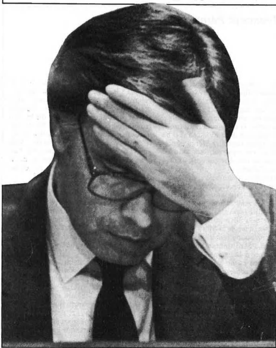
GONZÁLEZ CONTRA ELS TABÚS DEL FRANQUISME