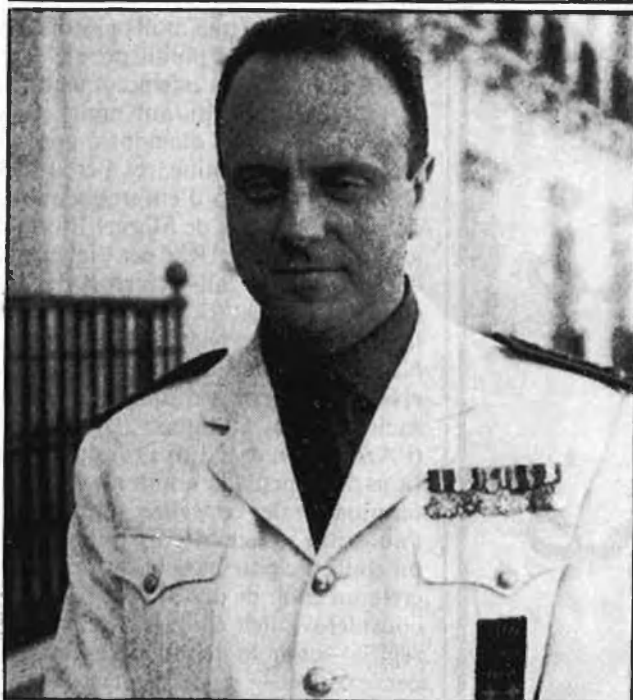
González aprofita l'estiu per acabar amb els fantasmes del passat de Fraga