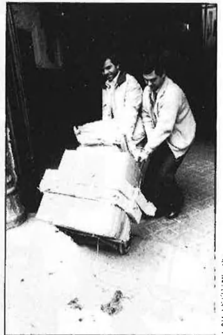
Excés de papers i de formalisme.

El llibre que dona peu a aquestes línies és La organización del desgo-bierno , d'A. Nieto (1984). El profesor Nieto compta amb una llarga i dilatada experiència, que permeten fer de les proposicions contingudes en aquest llibre afirmacions de caràcter axiomàtic. La seua reconeguda sol·lència, demostrada en innumerables