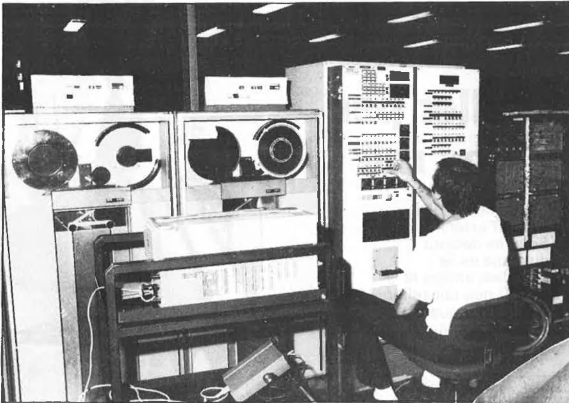
Aquest petit objecte és una memòria bipolar capaç de magatzemar 18.432 dades. Dalt, una computadora IBM.

dant que durant el 23-F s'usà l'argument que CCOO pretenia assaltar les casernes, entendrem que els límits d'aquest concepte no són tan clars com podria semblar.