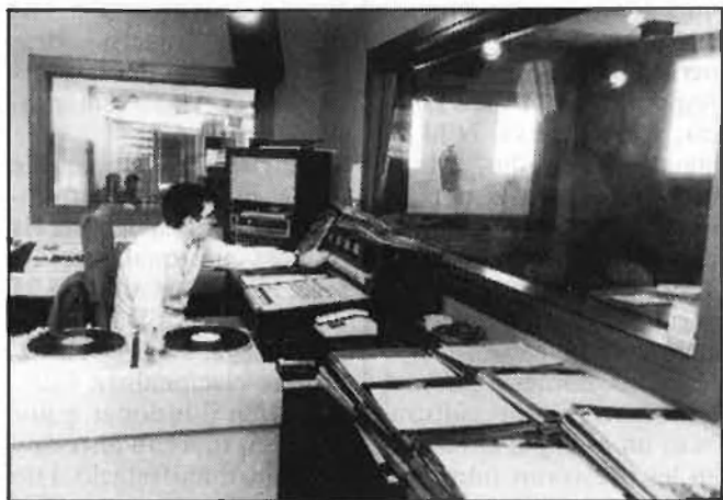
Estudis i redacció de la ràdio autonòmica

El resultat va ser que hagueren de buscar gent no-