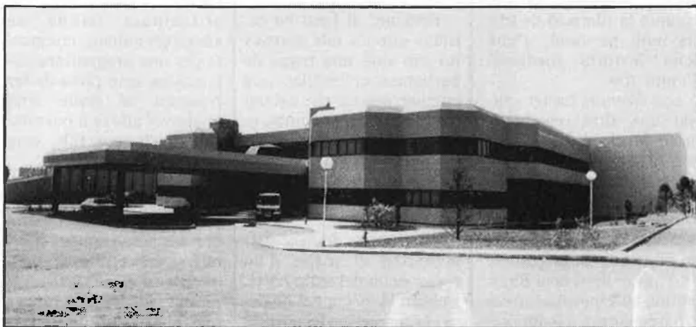
Estudis del Centre i aspecte exterior de les instal·lacions