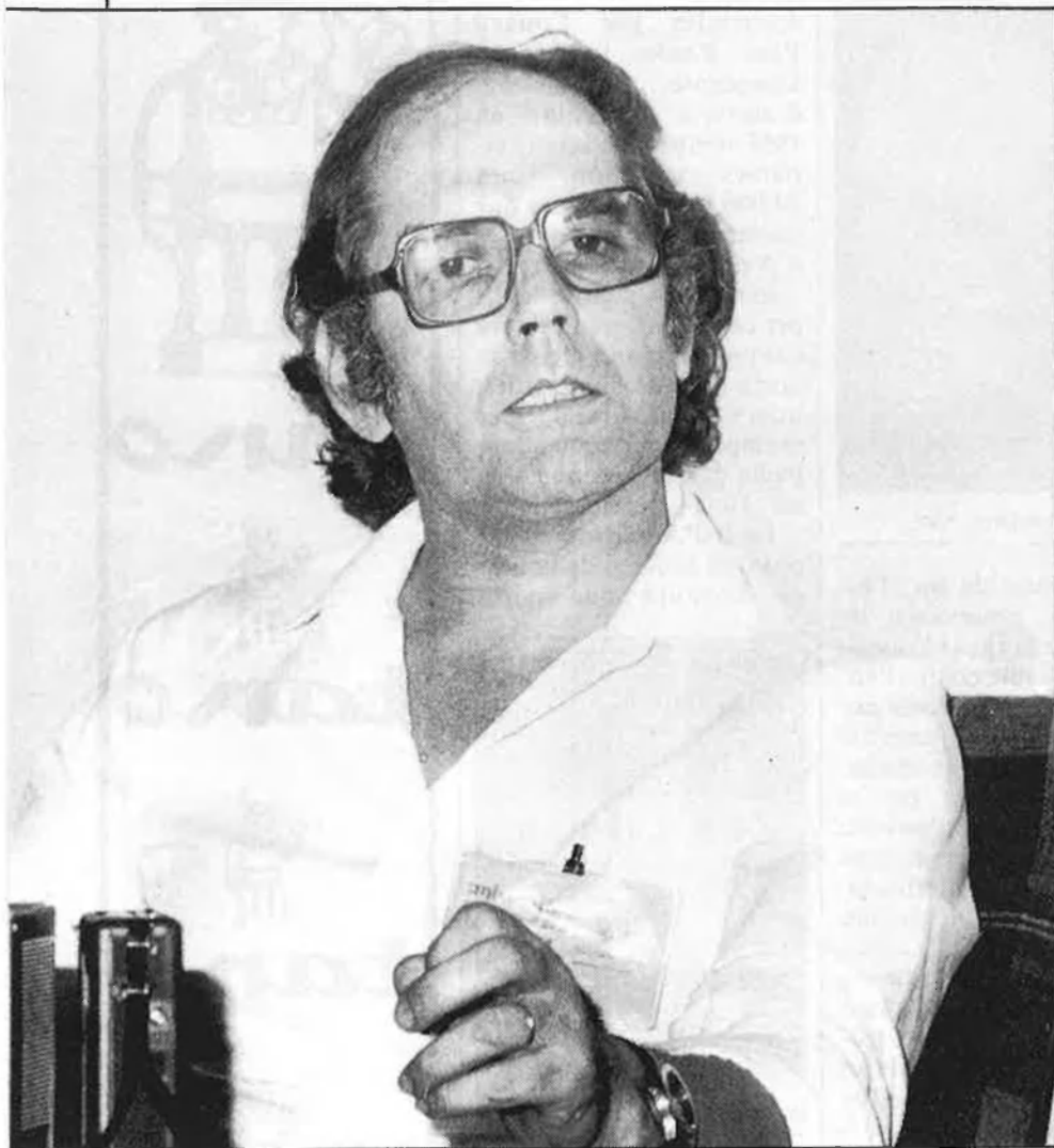
«El Premi Nobel obre la possibilitat d'una tribuna internacional»