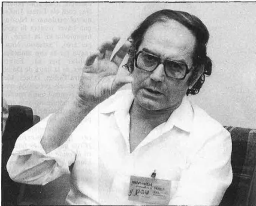
«Les forces polítiques no tenen respostes alternatives»

La conversa amb el Premi Nobel és inegotable. Pérez Esquivel viu i sent intensament tot Amèrica Llatina. Parlem de les repercussions de les darreres declaracions de Fidel Castro sobre la conquesta espanyola; dels desavantatges per a Amèrica Llatina de la incorporació d'Espanya a la CEE; de les contínues matances o dels desapareguts al Perú. I parlem també del desig que la Universitat de la Pau de San Cugat continuï sent un punt de convergència per a l'estudi i la recerca de la pau al món.