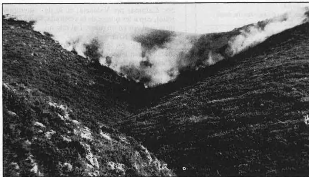
Les nostres muntanyes són òptimes per a cremar.

Pel març del 1980 en unes primeres Jornades Sobre el Medi Ambient, la meua ponència va ser «Els boscos del País Valencià i