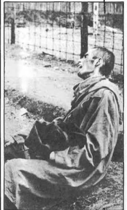
Entrar en un camp d'extermini era un passaport per a la mort

Per voluntat pròpia, i després d'haver estat en combat, va servir durant la Segona Guerra Mundial (1939-45) com a metge del camp d'extermini d'Auschwitz/Birkenau. Allà s'interessà especialment per ex-